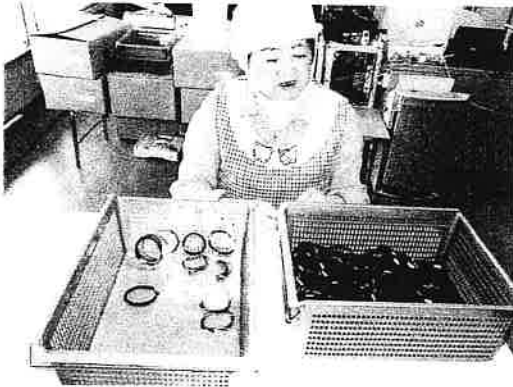
ヘアゴムを袋にいれています