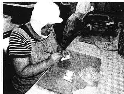
糊付けして箱にして完成